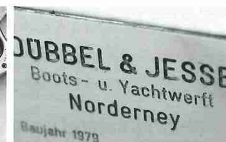
Eigentlich museumsreif (v. l. n. r.): die Anzeigen der Hydraulikanlage von Staerns, deren Produktion längst eingestellt wurde. Am Spi-geschirr sind noch Originalschäkel angeschlagen (M.). Seltenheitswert hat auch das Typenschild der Werft, die es nicht mehr gibt