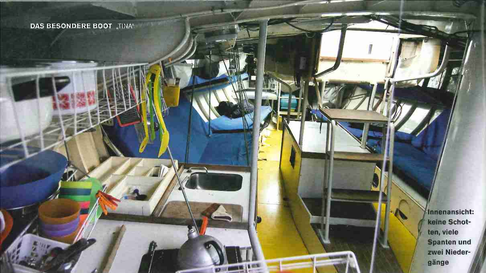
Innenansicht: keine Schoten, viele Spanten und zwei Niedergänge