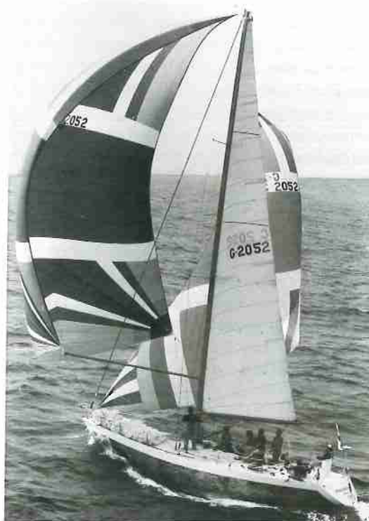
Segelplan anno '79: schmales Crosscut-Groß aus Dacron, Radialsplinker bis zum Topp und Big Boy

ZEICHNUNG: N. CAMPE